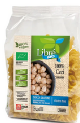
Foto del prodotto / Product's Photo