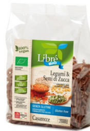
Foto del prodotto / Product's Photo