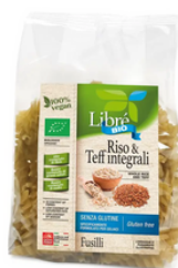
Foto del prodotto / Product's Photo