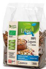
Foto del prodotto / Product's Photo