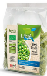
Foto del prodotto / Product's Photo